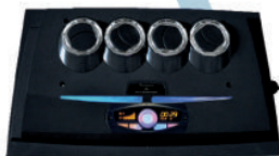
Tablero de control